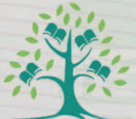
نادي كلية التربية