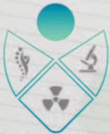
نادي العلوم الطبية MEDICAL SCIENCES CLUB