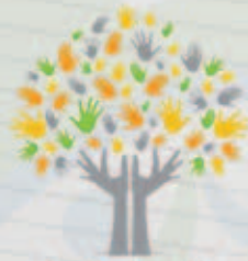
نادي العمل التطوعي Volunteer Work Club