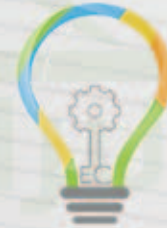
نادي الهندسة Engineering Club