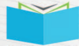
QEHC شركة التعليم النوعية القابضة Quality Education Holding Company