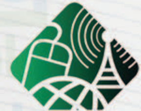
نادي الحاسب الآلي COMPUTER CLUB