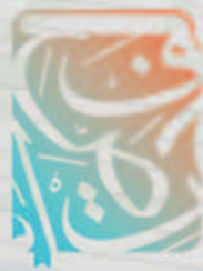
نادي صفحات للقراءة